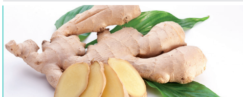
Jengibre Zingiber officinale